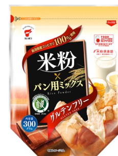
推奨番号：JPN-002 米粉パン用ミックス