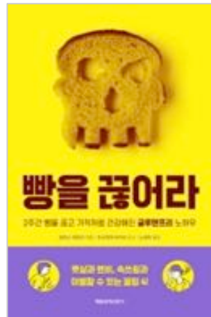
小麦は今すぐ、やめなさい (2018年3月発売) スペースシャワー