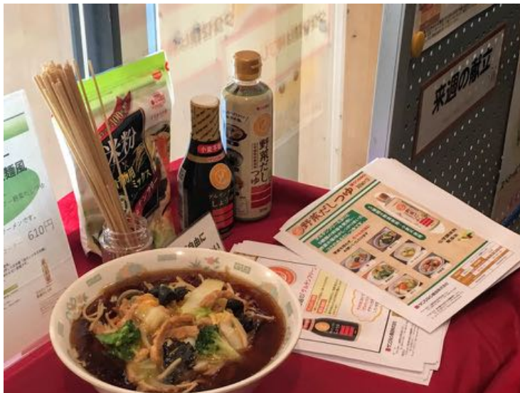
グルテンフリー&ヴィーガン広東麺風 ソイミートを使用した唐揚げのおむすび

「ベジタリアン・ヴィーガン食の普及」を推進する内閣府職員食堂では、“週に一度だけ菜食を実践する”という趣旨で、2017年3月から毎日「ベジメニュー」の提供が開始されています。ミートフリーマンデーオールジャパンからの呼びかけで、同食堂で当協会会員企業の商品を使ったベジメニューを提供する1日限定の催し「グルテンフリー&ベジランチ×グルテンフリーライフ協会」を実施しました。