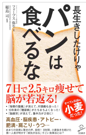
長生きしたけりゃパンは食べるな (2016年11月発売) SBクリエイティブ(日本語版・韓国語版)