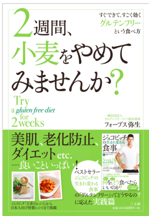
2週間、小麦をやめてみませんか? (2016年4月発売) 三五館