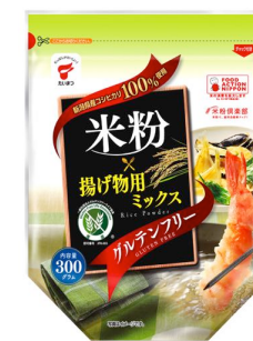
推奨番号：JPN-003 米粉揚げ物用ミックス