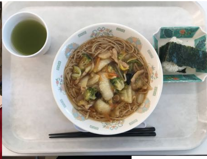
【法人会員協賛企業】 株式会社金のいぶぎ・たいまつ食品株式会社・サンジルス醸造株式会社