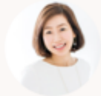
フォープス 弥生 Yayoi FORBES