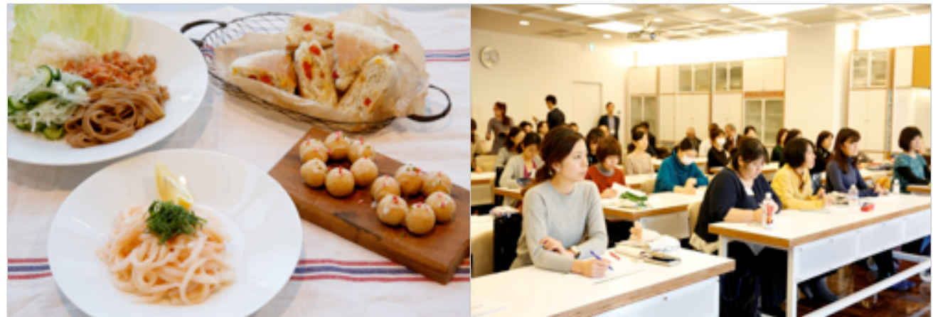
参照:ダイエット・健康情報サイト 学研・FYITE(フィッテ)